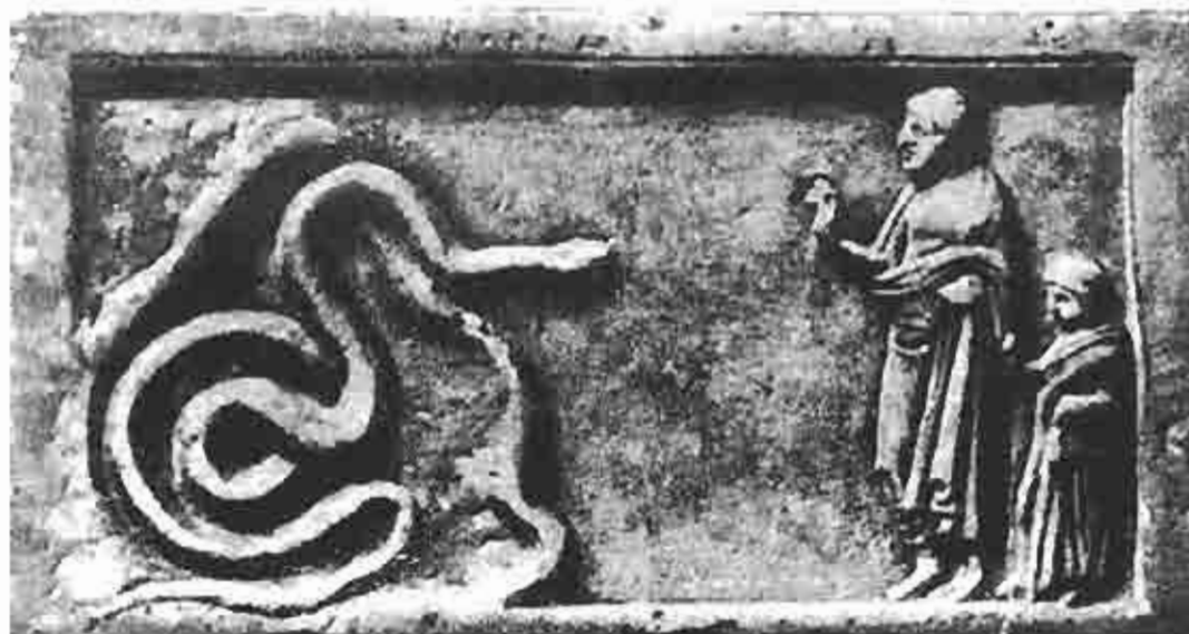
Sacrifício para a Divindade Serpente – Placa Votiva – Sialesi (Eteonis) Beócia

A idéia de transformação e renovação por intermédio da serpente tem fundamentos arquetípicos que podem ser encontrados, com freqüência, na história da humanidade. Animal que muda de pele e se renova, a serpente é também utilizada em rituais como instrumento de regeneração.