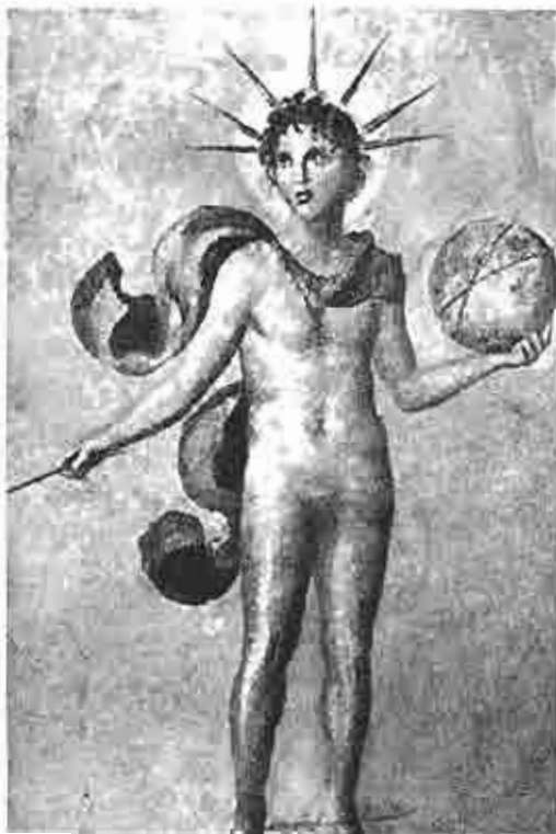
Deus-Sol instituído por Mithra, governador do mundo – baixo-relevo

Mithra é um deus solar e herói, cujo mito narra a dolorosa procura da consciência que o homem de todos os tempos vem representando sob mil faces.