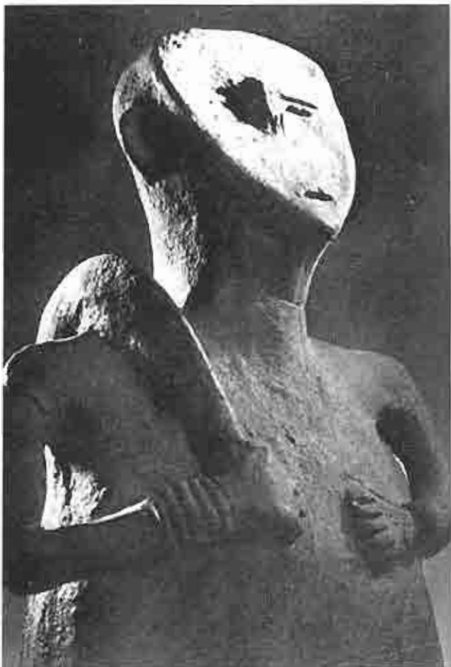
Cultura Tisza 5000 a.C.

“Raramente vi, talvez mesmo nunca haja vista, um só caso que deixasse de recuar às formas de arte do neolítico ou revelar evocações de orgias dionisíacas”.